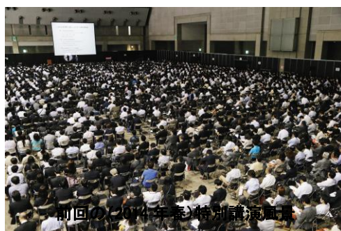
前回の(2014年春)特別講演風景