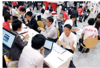
前回(2014年春)の展示会風景