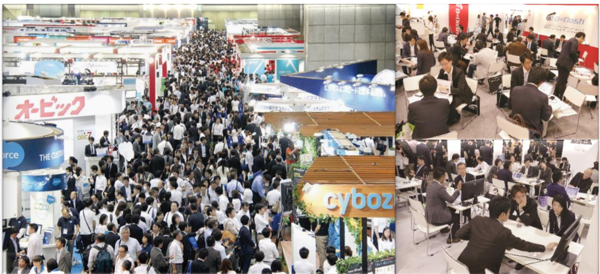
前回（2015 年春）の展示会風景

『Japan IT Week 春 2016』は、『第 13 回 情報セキュリティ EXPO【春】』において、情報セキュリティ対策のあらゆる製品・サービスが一堂に出展しています。そして企業、団体が現状もしくは今後抱える問題の解決や、新たなビジネスチャンスの創出、そして製品導入・商談の場を、国内外の業界関係者をはじめ、幅広いユーザーに情報を提供している必見の展示会となります。